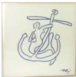
330 ▪ "Sem título" - SIZA VIEIRA (n. 1933) azulejo, decoração a azul e branco, séc. XX, assinado, marcado da Fábrica Viúva Lamego. Dim. - 14 x 14 cm Base de licitação: € 30