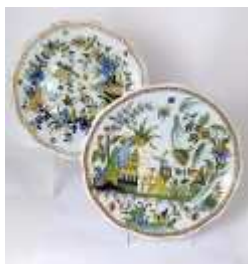
327 ▪ Par de pratos recortados faiança possivelmente de Moustiers, decoração policromadas diversas "Chinoiserie" e "Pássarsoe flores", 'séc. XX. Sinais de uso. Dim.:25 cm. Base de licitação: € 20