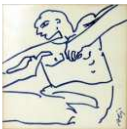
329 ▪ "Figura Masculina" - SIZA VIEIRA (n. 1933) azulejo, decoração a azul e branco, séc. XX, assinado, marcado da Fábrica Viúva Lamego. Dim. - 14 x 14 cm Base de licitação: € 30