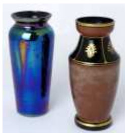
331 ▪ Duas jarras vidro irizado, pintado e dourado, decorações diversas, séc. XX, sinais de uso, pequenos defeitos. Dim.: 14 cm. Base de licitação: € 10