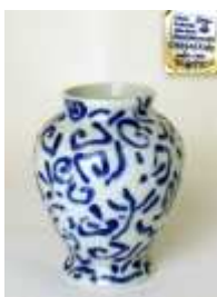
328 ▪ MANUEL CARGALEIRO - NASC. 1927 - Jarra decoração a azul, assinada e numerada 568/1500. Dim. - 13 x 10 cm Base de licitação: € 40